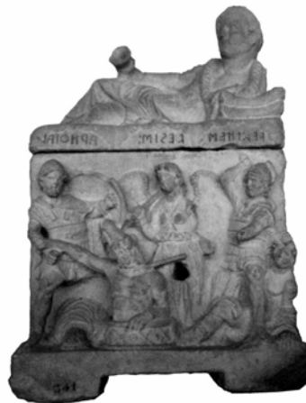
7. დამკრძალავი ურნა პერუჯის არქეოლოგიური მუზეუმიდან