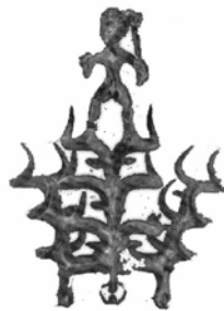
4. შტანდარტის თავი ყაზბეგის განძიდან