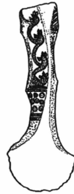
1. კოლხური ცული მესტიის არქეოლოგიური ბაზის ფონდიდან