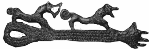
6. ბრინჯაოს საკიდი ყობანიდან, ი. დომანსკის მიხედვით