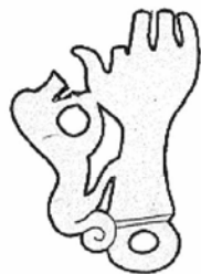
5. ბრინჯაოს საკიდი ჩრდილო კავკასიიდან (ყობანი) ა. მიღერის მიხედვით